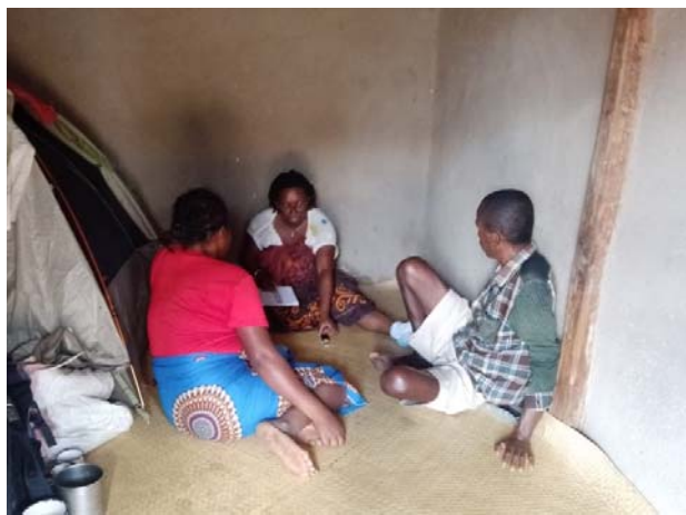
Entretien à Mikoboka