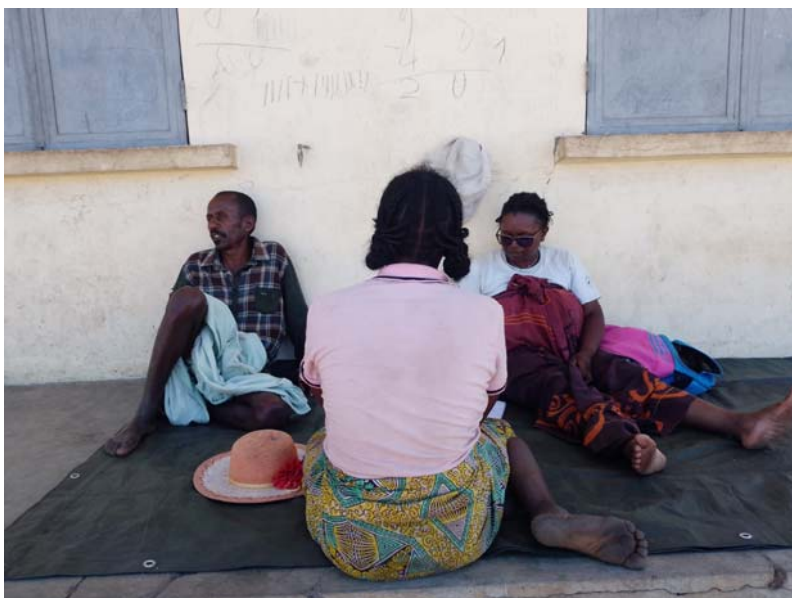
Entretien à Andranoheza

A Ambinanintelo , les informateurs en ont marre de l'éducation car l'enseignant FRAM ne vient pas. Il quitte le jeudi et ne vient plus pendant 1 ou 2 semaine. Pendant le mois de mars l'enseignant est venu travaillé seulement 2 fois. Enfin ils disent que leurs enfants ne savent rien et ne s'améliorent même pas avec le nouvel enseignant. Depuis que MBG a retiré d'enseignant de vacance, il n'y a aucune amélioration pour leurs enfants.