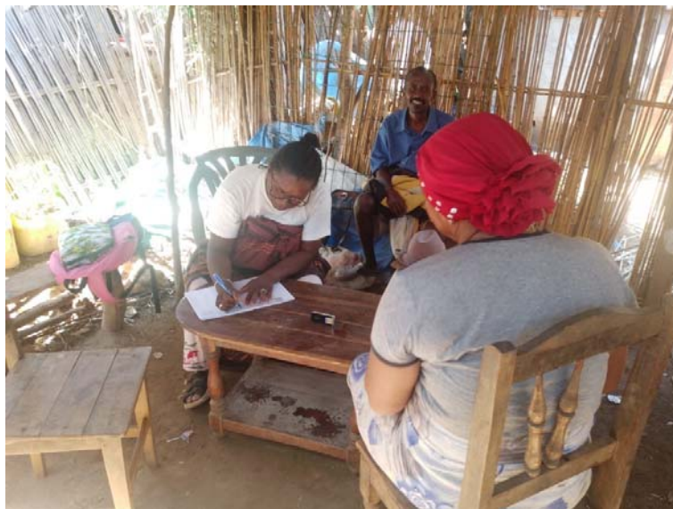
Entretien à Mahaboboka

Parlons des sentiments des informateurs à MBG, tous les informateurs ont des sentiments positifs envers MBG dont le ravissement (63%), l'amour (15%), le dynamisme de l'équipe qui donne des conseils aux gens, qui aide la population (12%), qui collabore avec les gens (10%). Les informateurs ont donné leurs bénédictions pour que les activités de MBG continuent toujours et d'autres veulent que MBG s'agrandissent de plus en plus.