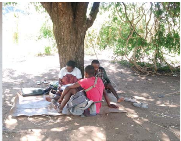
Entretien à Andranoheza