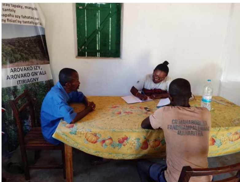
Entretien à Ambinanintelo

A Ambinanintelo , les informateurs en ont marre de l'éducation car l'enseignant FRAM ne vient pas. Il quitte le jeudi et ne vient plus pendant 1 ou 2 semaine. Pendant le mois de mars l'enseignant est venu travaillé seulement 2 fois. Enfin ils disent que leurs enfants ne savent rien et ne s'améliorent même pas avec le nouvel enseignant. Depuis que MBG a retiré d'enseignant de vacance, il n'y a aucune amélioration pour leurs enfants.